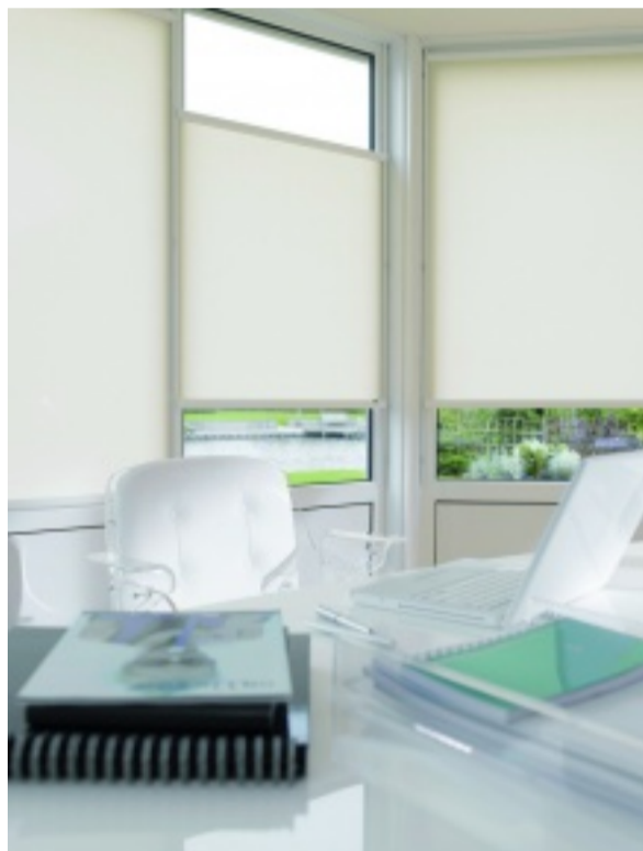
Je nach Lichteinstrahlung zu verschieben und direkt auf Maß vor der Scheibe montiert

Rollos dienen längst nicht mehr nur der Verdunkelung von Räumen, sondern sind heute sogar in der Lage wie ein Katalysator zu wirken.