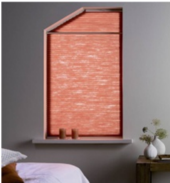
Auch schwierige Fensterformen sind kein Problem

Faltstores haben neben Ihrer dekorativen Wirkung auch die Funktionen eines Sichtschutzes, einer Verdunkelung und eines Schutzes vor direkter Sonneneinstrahlung. Faltstores gibt es ebenso mit Beschichtungen und Kammern, die helfen Energie zu sparen. 270 Farben von transparent bis lichtundurchlässig sind in verschiedenen Dekoren erhältlich.