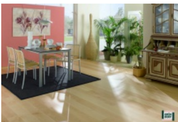
Laminatboden: extrem strapazierfähig

Wer jedoch Wert auf höchste Strapazierfähigkeit ohne bleibende Eindrücke legt, ist mit einem Laminatboden auf der sicheren Seite. Moderne Lamine sind in Bezug auf die Optik, Oberflächenstrukturen und Abmessungen vielfältig und kaum von echtem Holz zu unterscheiden. Sowohl beim Parkett, als auch beim Laminat reicht nebelfeuchtes Wischen mit entsprechenden Reinigungs- und Pflegeprodukten aus, um den Wert Ihres Bodens lange zu erhalten.