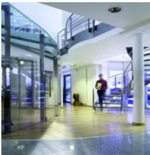
Auch angrenzend an Holzböden sind Designbeläge einsetzbar.

Design-Bodenbeläge verbinden eine immer breitere Auswahl interessanter Dekore mit den hervorragenden Pflegeeigenschaften moderner Kunststoffböden. Wer zum ersten Mal moderne Design-Bodenbeläge sieht, glaubt kaum, dass es sich tatsächlich um Böden aus PVC handelt. Täuschend echt erscheinen die Farben und Strukturen von edlen Hölzern, Natursteinen, Beton oder Metallplatten. Die Böden wirken auch deshalb so überzeugend, weil sie als Planken bzw. Fliesen verlegt werden. In gestalterischer Hinsicht eröffnen sich durch die geringe Aufbauhöhe der Böden vielfältige Optionen. Auch ein Produktmix mit anderen Belagsarten ist durchaus möglich. In Verbindung mit den passenden Bodenbordüren oder Akzentstreifen, erhalten Sie eine einmalige Optik, die speziell auf Ihre Raumsituation zugeschnitten ist.